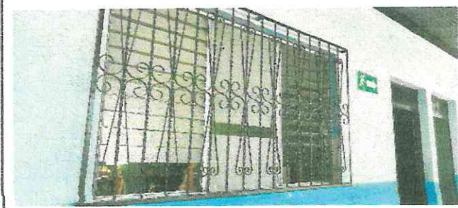
Foto1: Cambio de ventanas de paleta por ventanas de pvc